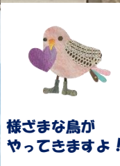
様ざまな鳥がやってきますよ！

↑ 何と！自然観察池の説明板の上に、池に棲む小魚を狙っています。早朝、撮影に成功しました。HPでもお伝えします。