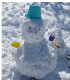
お母さんとお子さんの作品 カラフル！