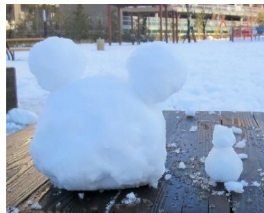
ミッキーと極小サイズ かわいい！ユニークなだるまさん「午後から授業！」と元気な女子高生お二人