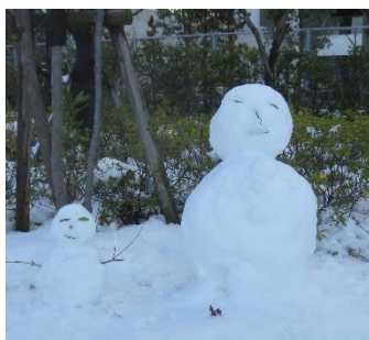
親子でしょうか？仲良く並んでいます